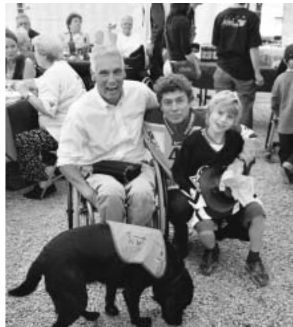
Convivialité cordiale lors de la Fête centrale 2004 à Thoune