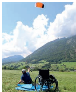
Rollikiten: Dieser Kurs findet nicht auf dem Wasser statt!

18. oder 19. Mai 2019 (je nach Wetter) in Alpnach Rollikiten als Einführung in den Kitesport Kosten pro Kurstag: CHF 180.–, exkl. Mittagessen