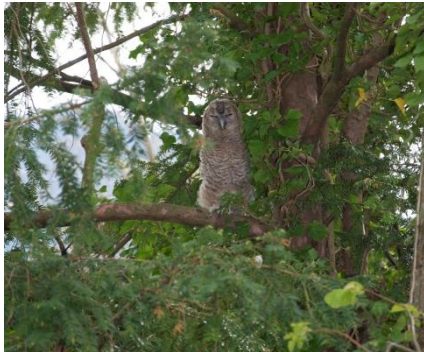
Waldkauz im Frühling 2012