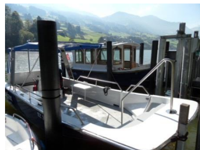
Transportboot „Seefax“ für Personen mit Behinderung

Es ist uns sehr wichtig, die Insel Schwanau ebenfalls für handycapierte Menschen zu einem unvergesslichen Ausflugsort zu machen.